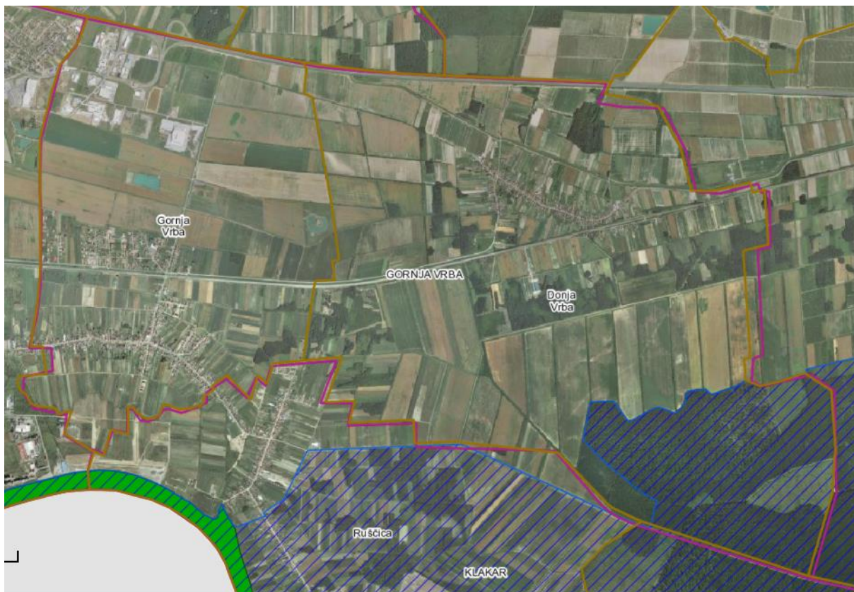
Slika 3: Zaštićena područja (Natura 2000)

Na području Općine Gornja Vrba postoji područja koje se nalazi u području ekološke mreže (Natura 2000). Nadležni Upravni odjel za graditeljstvo, infrastrukturu i zaštitu okoliša Brodsko-posavske županije je donio mišljenje da nije potrebno provesti postupak strateške procjene utjecaja na okoliš, niti provesti postupak ocjene prihvatljivosti za ekološku mrežu.