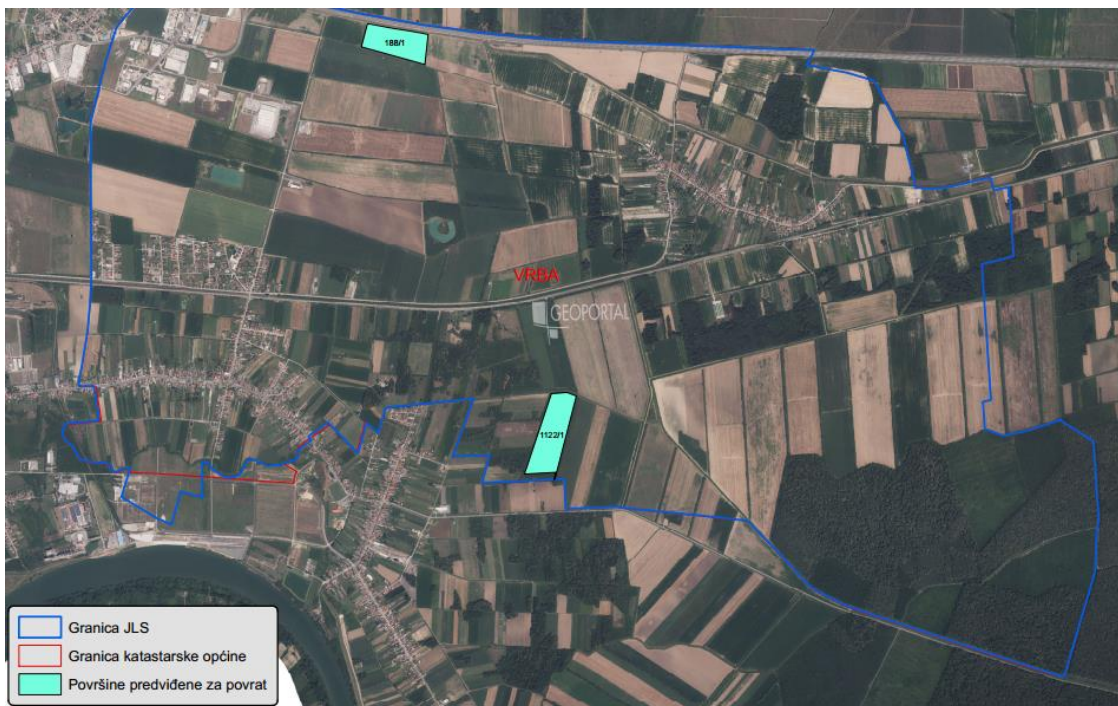
Slika 6: Površine određene za povrat