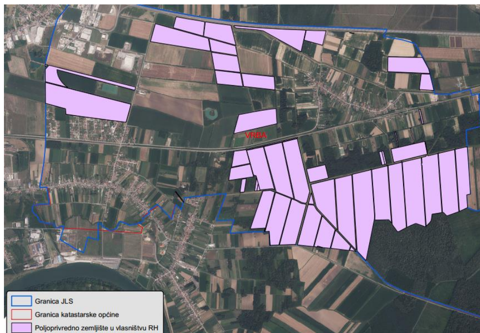
Slika 2: Državno poljoprivredno zemljište na području Općine Gornja Vrba

Prikaz katastarskih čestica poljoprivrednog zemljišta u vlasništvu RH na području Općine Gornja Vrba s podlogom digitalne ortofoto karte izrađena je prema službeno dostavljenim podacima Državne geodetske uprave za potrebe izrade Programa i nalazi se u prilogu KARTOGRAFSKI PRIKAZ 1, a njegov umanjeni prikaz vidljiv na slici 2.