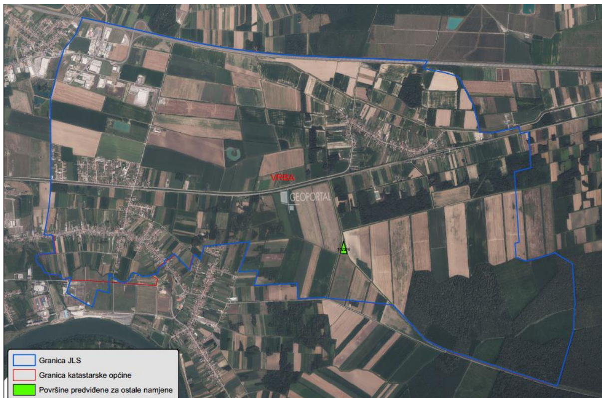
Slika 7: Površine određene za ostale namjene