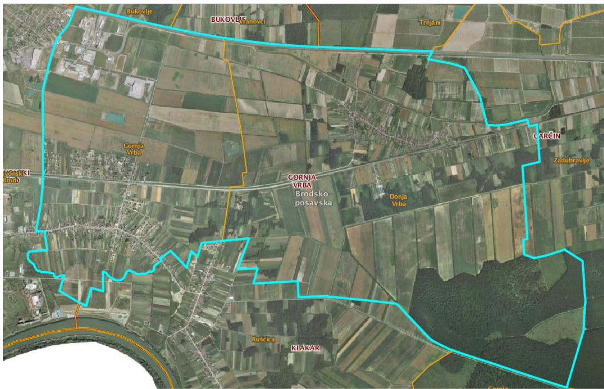
Slika 1: Naselja Općine Gornja Vrba

Općina Gornja Vrba prostire se na površini od 20 km 2 i sastoji se od 2 naselja: Donja Vrba i Gornja Vrba, prikazanih na slici 1.